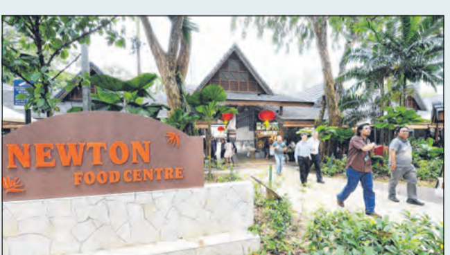
PUSAT MAKANAN NEWTON