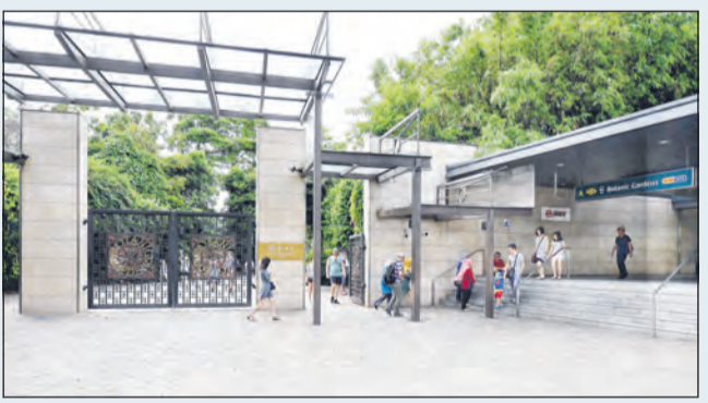
STESEN BOTANIC GARDENS

PUSAT MAKANAN NEWTON Sekitar lima minit berjalan kaki dari stesen Newton. Pusat makanan ini sangat popular dalam kalangan warga setempat dan pelancong.