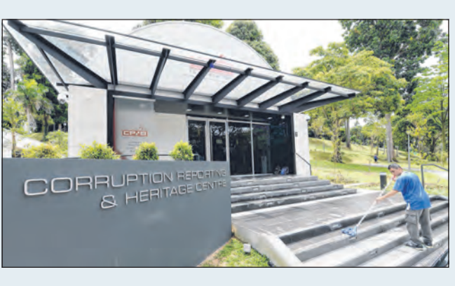
PUSAT LAPORAN RASUAH DAN WARISAN CPIB