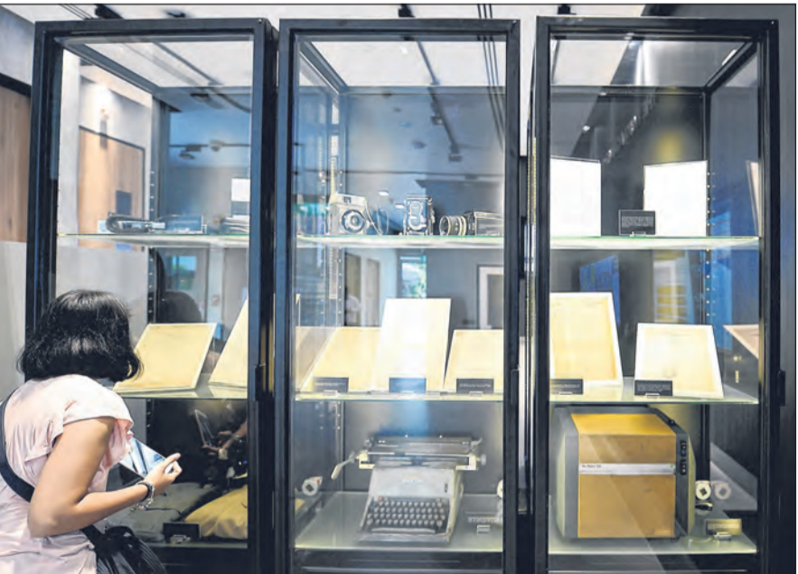
JEJAK WARISAN CPIB: Antara artefak di Pusat Laporan Rasuah dan Warisan CPIB ialah mesin taip, kamera dan uniform lama pegawai biro itu.

Pusat itu juga menempatkan galeri interaktif tentang rasuah pertama di Singapura.