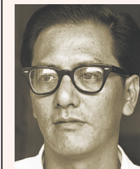
彭由国 前职总主席、 人民行动党议员

●案件：1979年，彭由国被控四项总共涉及8万3000元的失信罪。他也在职工会法令下被控两项罪名，指他未经部长许可，动用工会的公款在一家私人超级市场投资1万8000元。